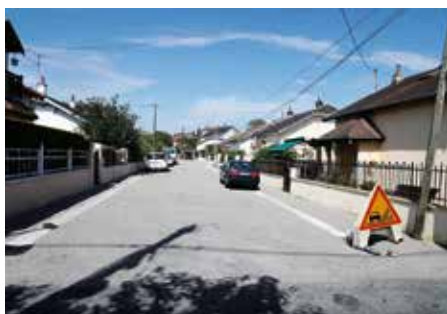
● Rue Louis Pergaud : réfection de voirie