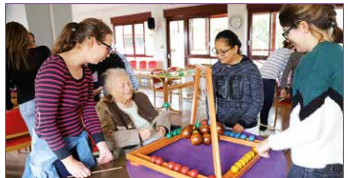
● Après-midi intergénérationnel au Val d'Amour entre enfants, adolescents et personnes âgées lors de la Semaine Bleue de 2019.

Comme depuis plusieurs années, un concours photo sera organisé par la Ville de Dole à cette occasion. Cependant, cette année, l'organisation de ce concours change. Ce seront