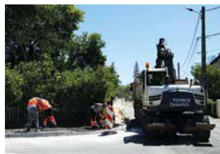
● Rue Léon Guignard : création d'un nouveau trottoir