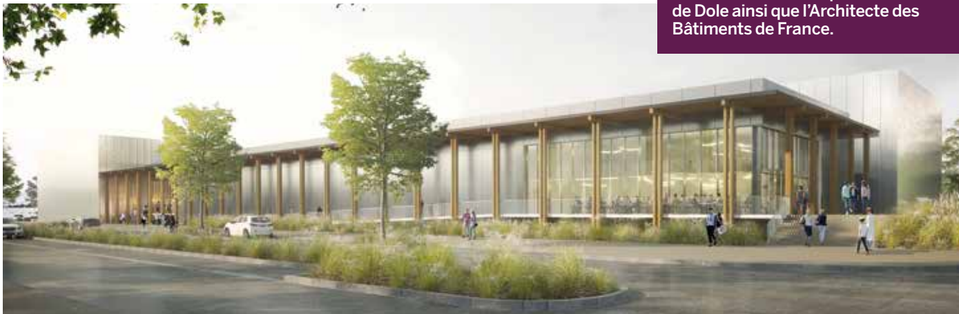
● vue du complexe depuis la rue Cordienne.

Majestic a travaillé à l'élaboration du projet avec l'agence d'architecture Linéai A, le concours des services urbanisme et techniques de la Ville de Dole ainsi que l'Architecte des Bâtiments de France.