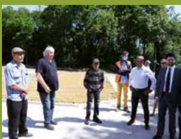
● Le Conseil Citoyen des Mesnils Pasteur, accompagné du Maire au pied de la tour 35 Carrel démolie.

L'ancien bâtiment abandonné, la tour 35 Carrel, a été démoli ! Se trouvant au pied de la nouvelle aire de jardins partagés, prairies et voie verte, sa démolition contribue à étendre encore plus ce nouvel espace de détente. Après avoir été des logements sociaux, les locaux de l'association Poinfore ou encore ceux des Restos du Cœur, ils sont inexploités depuis 2017. Au final, cet espace partagé s'étendra de l'Avenue de Verdun à l'Avenue Maréchal Foch, pour offrir ainsi un maximum d'espace aux habitants.