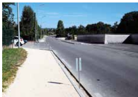
● Val d'Amour : réfection des trottoirs