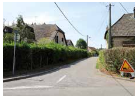
● Goux - rue de la Croix Blaisot : réparation de voirie