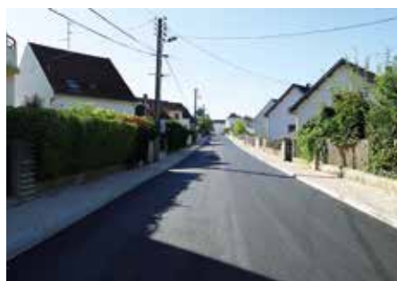
● Rue Benjamin Constant : réfection de voirie et trottoirs