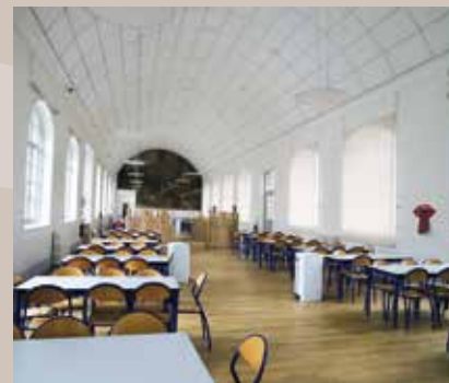
● Vue du réfectoire rénové.

En 2018, l'école Wilson a commencé sa métamorphose, sous l'égide de la Ville de Dole. La première phase de rénovation était destinée à accueillir les élèves des Commards, partagés également avec l'école Rockefeller rénovée également.