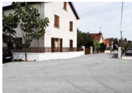
● Rue Etienne Dusart : réparation de voirie