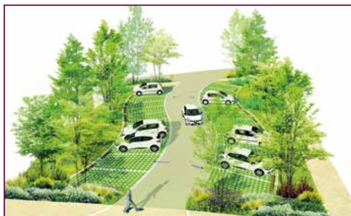
● Vue détaillée du futur parking.

Parallèlement, des parkings seront créés. D'une capacité de 190 places pour véhicules légers et de stationnements réservés aux deux-roues., ils auront la particularité d'être totalement végétalisés. Il s'agit en effet d'intégrer totalement