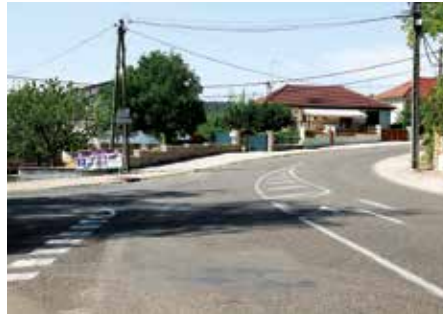
● Rue des Bugnardes : réparation des trottoirs