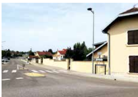
● Chemin du Defois : réfection des trottoirs