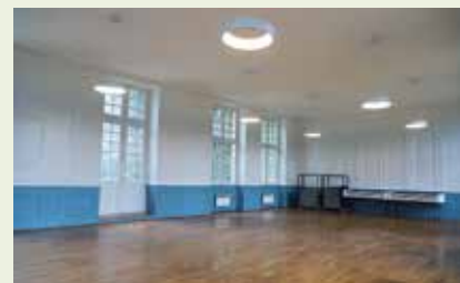
● La salle des Arquebusiers.

La salle des Arquebusiers ainsi que la salle de St-Yllie ont été rénovées. La Ville de Dole met à disposition ces salles afin de permettre à toutes les associations doloises d'organiser leurs événements et assemblées générales.