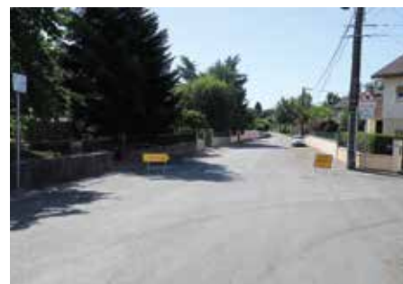
● Rue Charles Blind : réfection de voirie