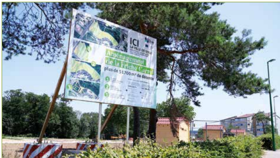
● L'ancienne Friche Carrel devient une extension des jardins familiaux.