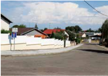
● Rue Justin Pannaux : réparation des trottoirs

En attendant, un grand bravo à tous ceux qui embellissent et colorent leurs habitations : ils rendent la ville encore plus belle !