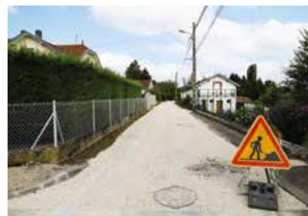
● Rue des Grandes Carrières : réfection de voirie