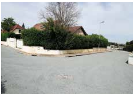
● Impasse des Perrières : réparation de voirie