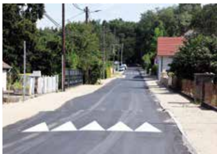
● Goux - rue du Gouvernon : réparation de voirie, trottoirs et création de ralentisseurs