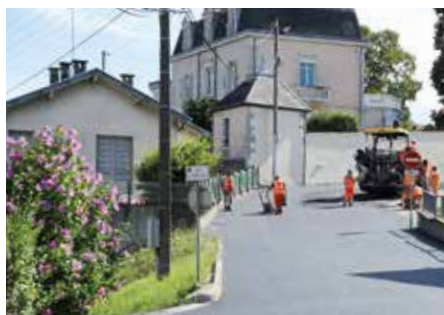
● Rue des Buvettes : réfection de voirie

A ménagements de sécurité, poursuites de la création des voies cyclables, reprise des marquages au sol, rénovation des enrobés, réfection de trottoirs, pose de plaques d'évacuations des eaux pluviales, ... la période estivale a été à nouveau propice aux nombreux travaux de voiries selon la programmation pluriannuelle présentée en janvier mais aussi à l'entretien des espaces publics.