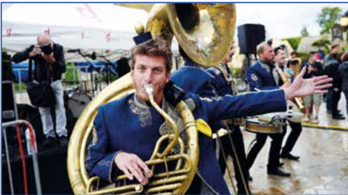
● Retour sur la 9 e édition