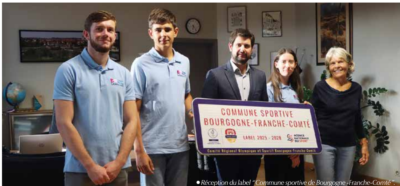
• Réception du label "Commune sportive de Bourgogne-Franche-Comté".