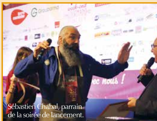
Sébastien Chabal, parrain de la soirée de lancement.

Dégustations, découvertes artisanales, animations, Banquet du chat... Durant tout le week-end, le Centre-Ville de Dole s'est transformé en un véritable festival de saveurs et de convivialité !