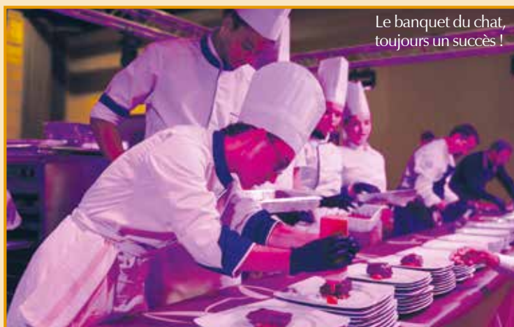
Le banquet du chat, toujours un succès !