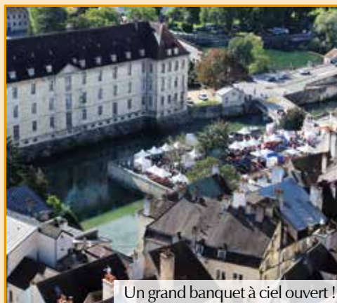
Un grand banquet à ciel ouvert !