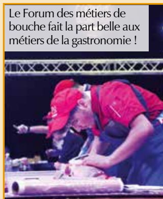
Le Forum des métiers de bouche fait la part belle aux métiers de la gastronomie !