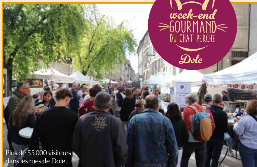
Plus de 55 000 visiteurs dans les rues de Dole.