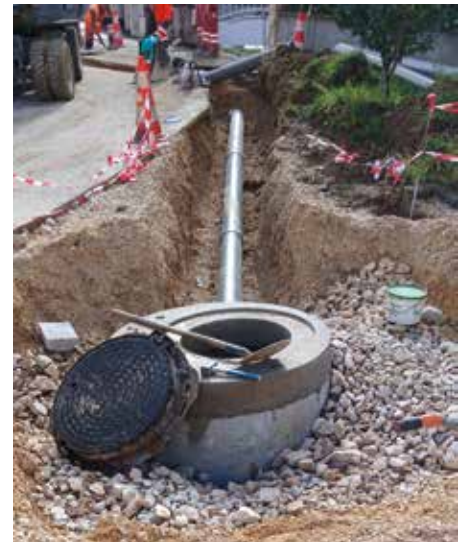
● Création d'un puits perdu rue Camille Claudel.

nissement a été lancé durant l'été 2025. Ce travail, associé à l'élaboration d'un schéma de gestion des eaux pluviales, vise à établir un plan d'actions durable à l'échelle de toute la ville, afin d'intégrer la gestion des eaux pluviales dans les projets d'aménagement et améliorer l'efficacité globale des réseaux, tout en respectant le cycle naturel de l'eau.