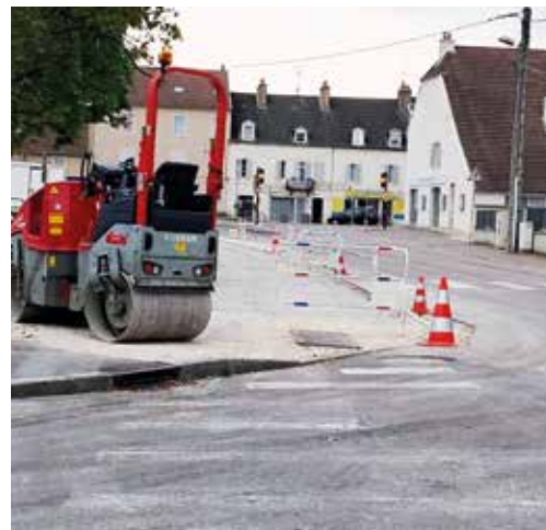
● Réfection d'un trottoir rue des Fourches.