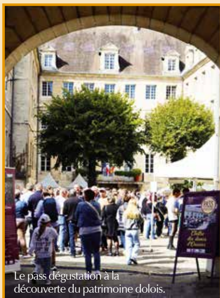
Le pass dégustation à la découverte du patrimoine doleois.