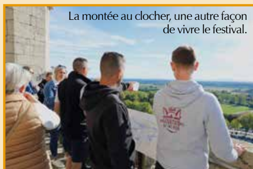
La montée au clocher, une autre façon de vivre le festival.