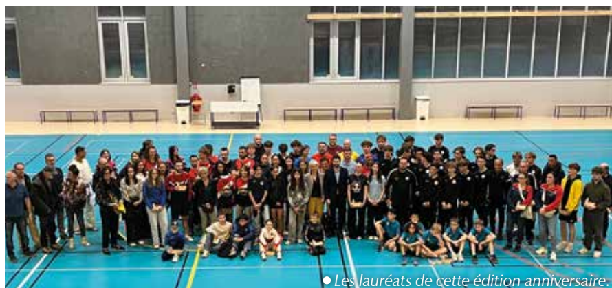
• Les lauréats de cette édition anniversaire.

Le 24 octobre, le gymnase d'honneur de l'Espace Pierre-Talagrand accueillait la dixième édition des Trophées des Sports, mettant à l'honneur plus d'une centaine de jeunes espoirs, sportifs confirmés, clubs, encadrants et bénévoles pour leurs performances et leur engagement. Tout au long de la saison, ils ont porté haut les couleurs doloises et grand doloises lors de compétitions départementales, régionales et nationales. Cette édition anniversaire, organisée par la Ville de Dole, en partenariat avec l'Office Municipal des Sports et l'Amicale des Médailleurs Sportifs, a rencontré une participation record, témoignage de la vitalité du sport local et de l'esprit collectif qui