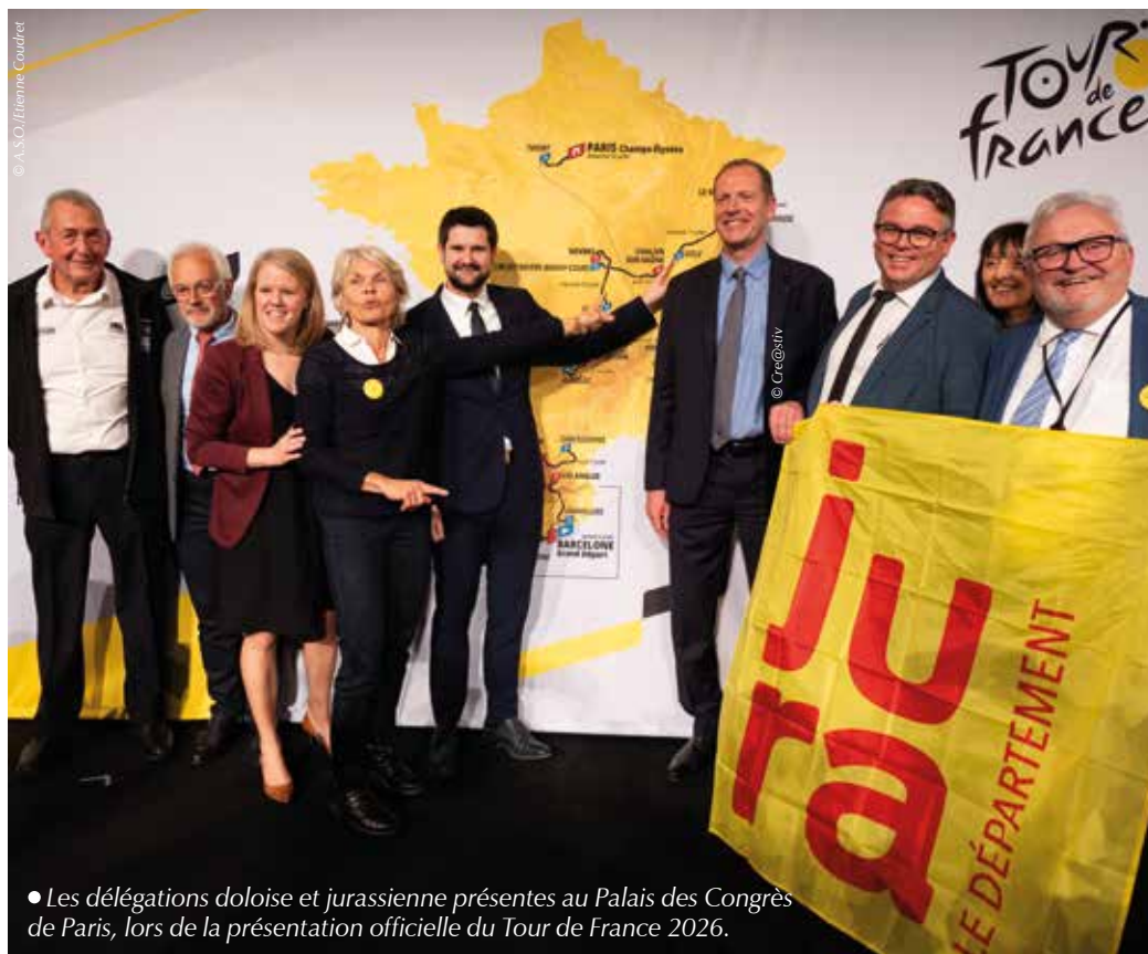
• Les délégations doloise et jurassienne présentes au Palais des Congrès de Paris, lors de la présentation officielle du Tour de France 2026.