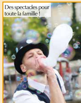
Des spectacles pour toute la famille !