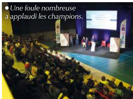
• Une foule nombreuse a applaudi les champions.

anime la cité. Entre applaudissements, hommages et fierté partagée, la soirée a offert un concentré d'émotions et de convivialité. Un moment qui illustre l'importance du sport comme lien social, moteur de cohésion et vecteur d'excellence.