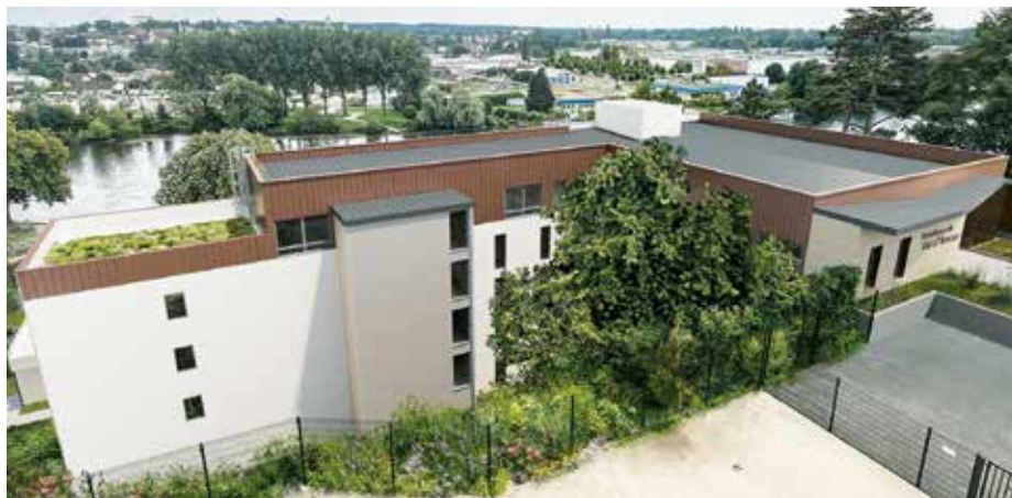
● Vue sur les toits depuis l'Espace Pierre-Talagrand.