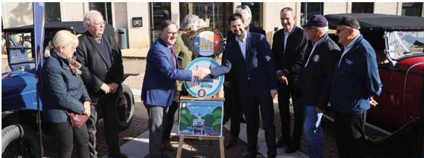
● Remise officielle du label à l'Hôtel de Ville, en présence des représentants de la FFVE, du Old Cars Club Jurassien et des élus municipaux.

C'est officiel ! Dole fait désormais partie du réseau des “Villes d'accueil des véhicules d'époque”, une distinction décernée par la Fédération Française des Véhicules d'Époque (FFVE). La remise officielle du label s'est tenue le mardi 4 novembre à l'Hôtel de Ville, en présence des représentants de la FFVE, du Old Cars Club Jurassien et des élus municipaux.