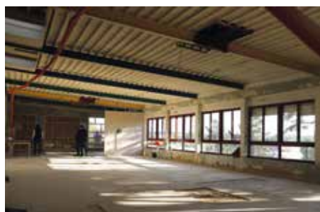
● Bientôt, un lieu partagé pour tous les résidents.

La phase de curage et de désamiantage des bâtiments s'est récemment achevée, marquant la fin des premiers travaux préparatoires. Sur le site, situé entre la place Barberousse et les rives du Doubs, des logements témoins sont désormais en cours d'aménagement. Ils permettront de valider les choix d'agencement, de décoration et de confort avant d'engager la restructuration complète du bâtiment.