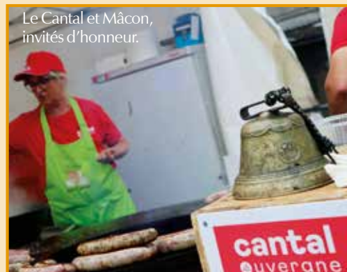
Le Cantal et Mâcon, invités d'honneur.