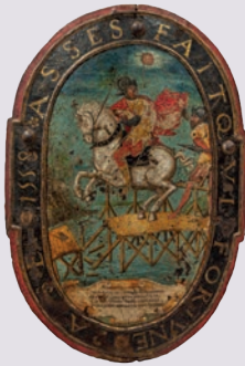
Cl. CRRCOA de Vesoul