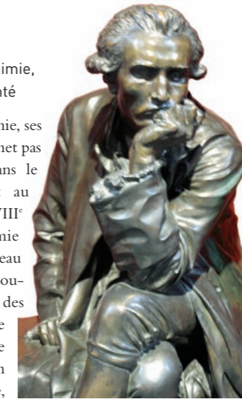
Antoine-Laurent Lavoisier par Jules Dalou, 1866.

Jusqu'au XVI e siècle, l'alchimie, ses recettes et ses secrets, ne permet pas d'avancées significatives dans le domaine théorique. C'est au XVII e et encore plus au XVIII e siècle que naît une chimie raison-née, grâce au renouveau des idées, à certaines découvertes et à l'élaboration des fondements modernes de cette science. Les acteurs de ce changement ont pour nom Van Helmont, Lemery, Boyle, ou enfin Lavoisier.