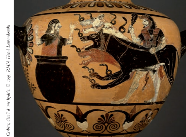
Cerbère, détail d'une hydrie.

Que nous apprennent L'Odyssée de Homère et son héros principal, Ulysse, sur l'histoire et l'imaginaire de la civilisation grecque au VIII e siècle av. J.-C. ? La conférence proposera d'élucider la manière dont se sont formés, sur les plans historique et culturel, les monstres et autres paysages inquiétants - ou paradisiaques - qui sont autant de clés pour comprendre la vision du monde et de la Méditerranée des anciens Grecs.