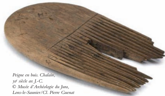
Peigne en buis. Chalais, 3 e siècle av. J.-C.

► MAXIME FERROLI Conservateur des Archives municipales de Dole