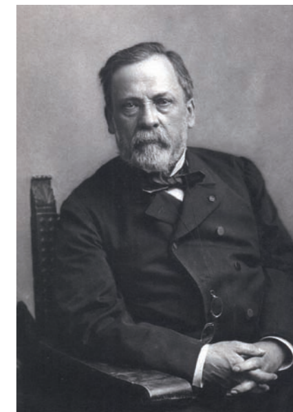
Louis Pasteur, par Félix Nûlar, 1895

Louis Pasteur, chimiste, est considéré comme le père de la microbiologie et son mémoire sur la fermentation lactique comme l'acte de baptême de cette science nouvelle. Chimie et physique sont étroitement liées et continuent à jouer un rôle essentiel dans la compréhension du monde bactérien. Microscopie à très haute performance et génomique sont les nouveaux outils des chercheurs.