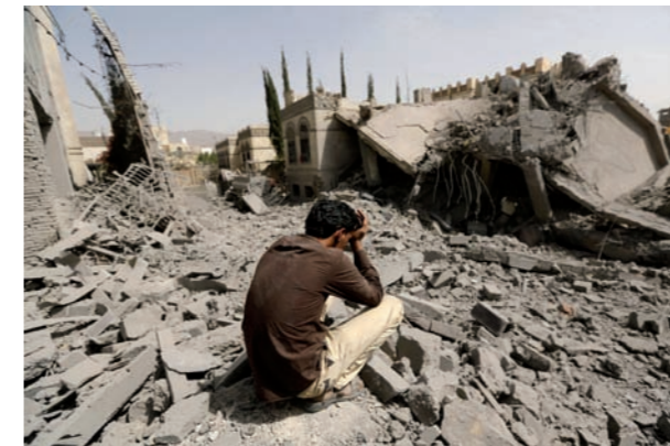
Sanaa, Yémen, 15 juin 2015 après une frappe aérienne.

Le monde actuel est en proie à des tensions rarement observées depuis la fin de la Seconde Guerre mondiale. Ces deux séances permettront de faire un zoom sur les points chauds d'actualité au moment de la séance. En tout état de cause, nous traiterons du repositionnement de la Chine dans la grande région asiatique et de la poudrière proche-orientale. Ces deux séances reposent sur une veille active autour des questions majeures de géopolitique dans le monde.