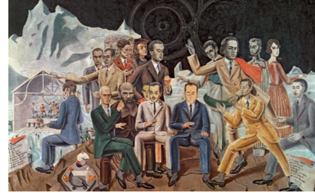
Max Ernst, Au rendez-vous des amis, 1922. Musée Ludwig de Cologne.

Saint Augustin, romain d'Afrique, est né en 354 à Thagaste. Il meurt en 430 à Hippone, la ville dont il était l'évêque, alors assiégée par les Vandales : il a connu la prise de Rome par Alaric en 410 puis l'effondrement de l'Empire romain d'Occident. Témoin privilégié d'une période cruciale de l'histoire, Il fut aussi un chrétien, Père de l'Église, hanté par les questions essentielles de la grâce et de la nature de Dieu. Il fut enfin un écrivain de génie, dont l'œuvre abondante ne se limite pas aux célèbres Confessions .