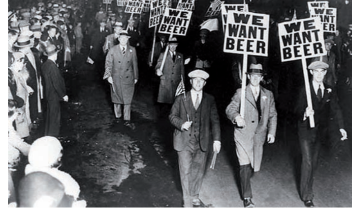
We want beer prohibition

Coup de projecteur sur la ville de Naples, prise en sandwich entre deux monstres volcaniques : le Vésuve et les champs Phlégréens... et le plus dangereux n'est pas celui qu'on croit !