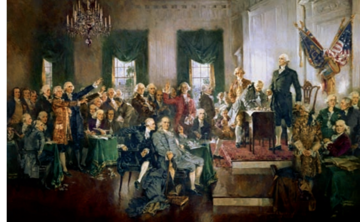
Howard Chandler Christy, Scène à la signature de la Constitution des États-Unis, 1940, huile sur voile de bateau, Capitole, Chambre des représentants des États-Unis, Washington

Scipione Pulzone, dit Il Gaetano et atelier (1544-1598), Portrait du cardinal Antoine de Granvelle, 1576. Huile sur cuivre. Legs Boissot.