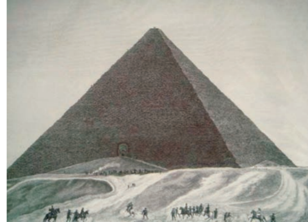
Pyramide de Memphis. Vue de l'entrée de la grande pyramide de Memphis.

Rouler pour un litre aux 100 kilomètres ? Pour une partie de la population de la France périphérique, l'automobile reste un moyen de transport indispensable, la question est donc de savoir quelles sont les perspectives d'évolution possibles ? Après une présentation des problématiques énergétiques liées au transport routier, nous nous attacherons à comprendre les méthodes permettant des progrès significatifs.