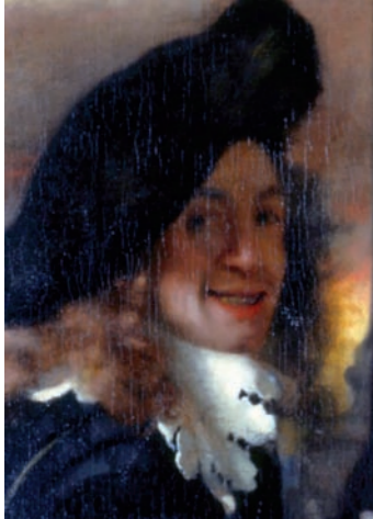
Vermeer de Delft, L'Entremetteuse (détail), autoportrait présumé de l'artiste. Gemäldegalerie Alte Meister de Dresde.