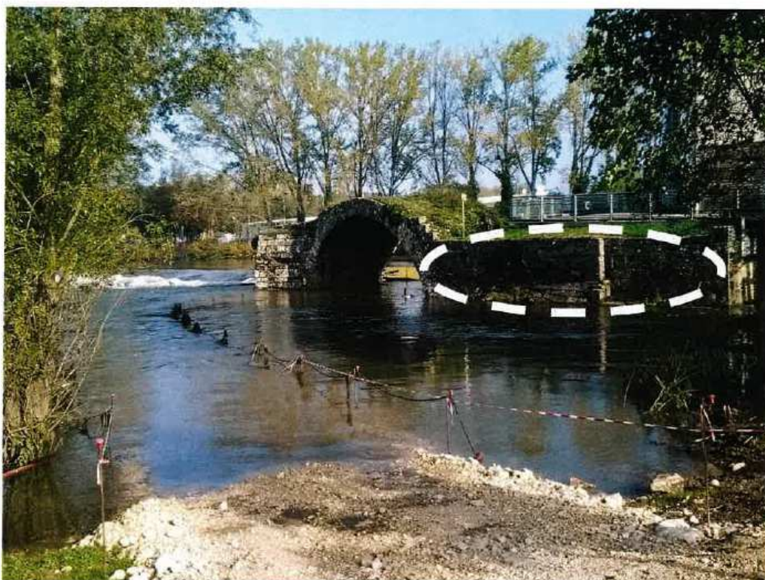
En blanc : mur en prolongement de la pile de l'arche, objet du PC modificatif