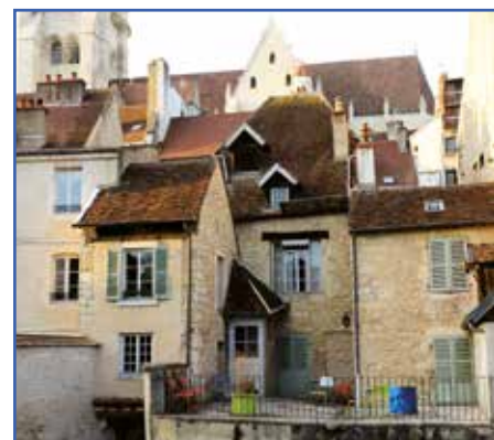
• Vue de la maison natale de Louis Pasteur située au 43, Rue Pasteur.

chercher un remède aux épidémies en 1877. Son idée : isoler les micro-organismes, les affaiblir en laboratoire, puis les insérer dans le corps des malades. En 1885, un enfant attrape la rage. Pasteur teste donc sa méthode sur lui, cela fonctionne. Le vaccin est né ! Pasteur imagine alors un laboratoire pour développer la vaccination dans le monde entier. Le 14 novembre 1888, l'Institut Pasteur ouvre ses portes. Il le dirigera jusqu'à sa mort en 1895.