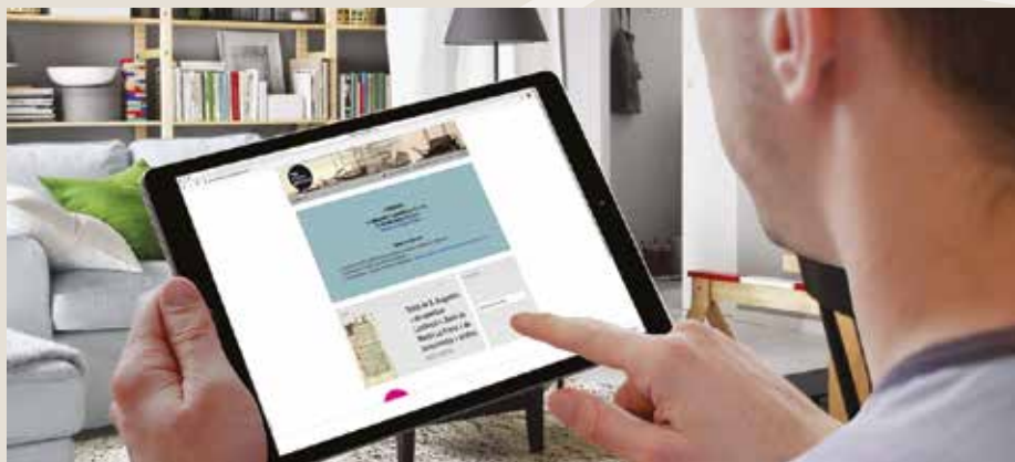
• Consultation du portail Patrimoine et archives.

Le défi dans les années à venir sera de poursuivre la numérisation des documents, bien que certains soient d'ores et déjà disponibles sur le portail de la médiathèque. Pour valoriser ces documents, les agents des Archives municipales participent régulièrement à des expositions thématiques comme