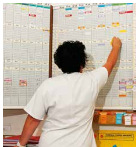
• Les plannings de suivi sont établis longtemps à l'avance.

• Le CHS réfléchit également à la création d'une unité pour personnes handicapées vieillissantes et à la mise en place d'une pharmacie à usage intérieur qui serait commune avec l'hôpital Louis-Pasteur dans le pôle médicoteknique.