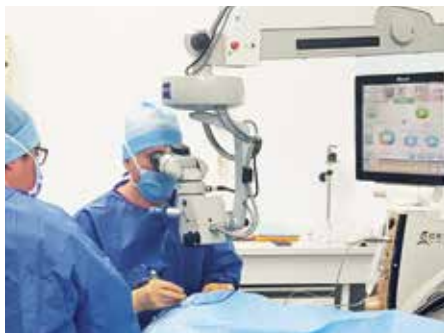
• Chirurgien opérant un patient atteint de la cataracte.

séjours en hospitalisation ambulatoire et 30 % en hospitalisation complète.”