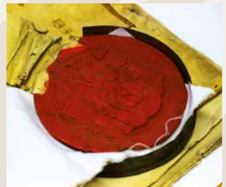
• Exemple d'un sceau de Charles Quint authentifiant des documents.

Parmi les documents gardés précieusement dans les coursives du service, on peut trouver la charte de franchises de la Ville de Dole datant de 1274. Les documents les plus consultés sont les registres paroissiaux, le plus ancien remonte à 1575, et ceux de l'état civil jusqu'en 1916. La suite de ces registres est conservée à la mairie. Par exemple, le service détient l'acte de naissance de Louis Pasteur né le 27 décembre 1822 à 2h du matin.