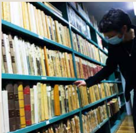
• Rayonnage d'archives.

Entre les rayonnages, les archivistes ne raisonnent pas en termes de pièces ou en nombre d'ouvrages, mais en mètres linéaires. À Dole, un kilomètre de documents est ainsi conservé.