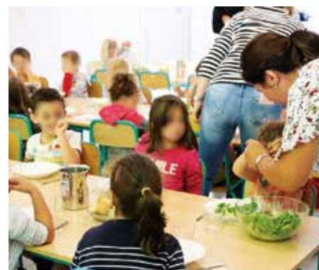
• Repas servis aux enfants dans les cantines du Grand Dole avec des légumes issus de producteurs locaux.

"Tout cela est très positif et débouchera sur des actions concrètes. L'objectif est