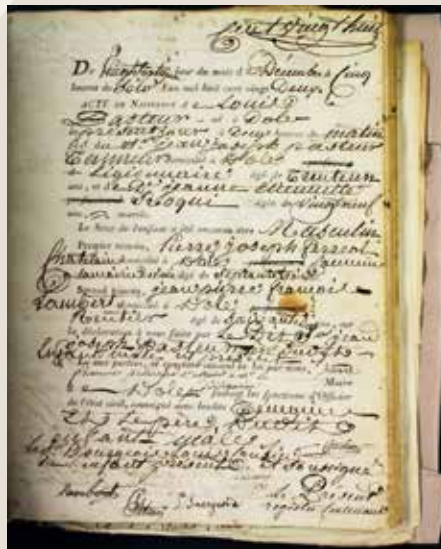
• Acte de naissance de Louis Pasteur.

Ces archives ne sont pas conçues à l'origine pour servir l'histoire. Elles sont l'ensemble des documents produits