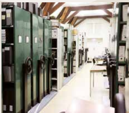
• Réserve des Archives municipales.

Le défi dans les années à venir sera de poursuivre la numérisation des documents, bien que certains soient d'ores et déjà disponibles sur le portail de la médiathèque. Pour valoriser ces documents, les agents des Archives municipales participent régulièrement à des expositions thématiques comme