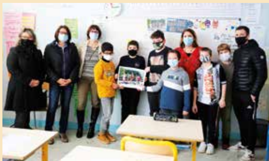
● Prix coup de cœur remporté par la classe ITEP de l'école Beauregard.