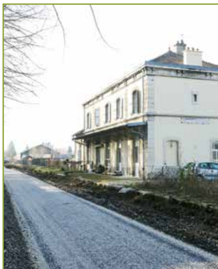
● La voie douce prend forme devant l'ancienne gare de La Bedugue.

Large d'environ 2,5 mètres, la voie verte sera accessible aux piétons, aux vélos, aux trottinettes, aux poussettes ainsi qu'aux personnes à mobilité réduite. Afin de rendre les déplacements agréables, des accotements resteront enherbés et arborés.