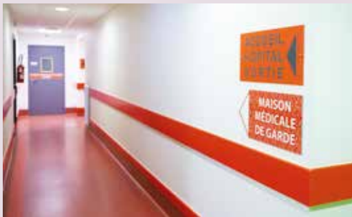
• La maison médicale de garde se situe à côté des urgences.