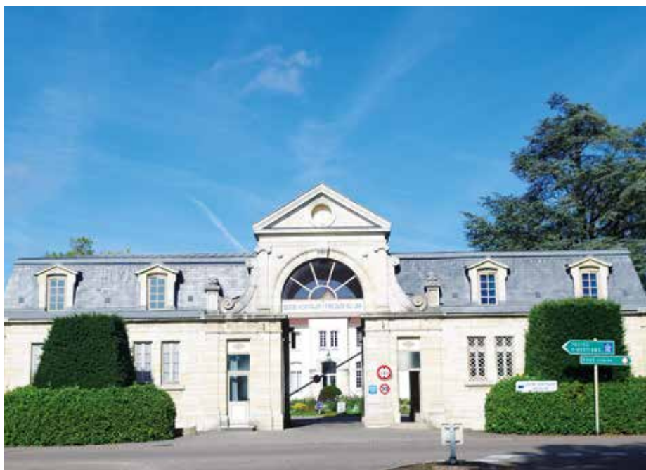
• Entrée principale de l'imposant complexe de soins psychiatriques.

C'est un établissement public de santé mentale qui s'adresse à l'ensemble de la population du département du Jura, soit près de 260 000 habitants.