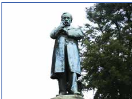
• La statue de Louis Pasteur installée sur le Cours Saint-Mauris.

L'année 2022 sera l'année "Pasteur". La Ville de Dole, en collaboration avec un certain nombre d'acteurs tels que l'association des Amis de Pasteur, l'Établissement public de coopération culturelle Terre de Louis Pasteur, l'Université Bourgogne-Franche-Comté, le Rectorat, l'Académie des Sciences, s'attelle dès à présent à l'organisation de cet événement et de nombreux projets sont en cours de réflexion. La Ville de Dole désire marquer le coup, afin que tout à chacun puisse marcher dans les pas