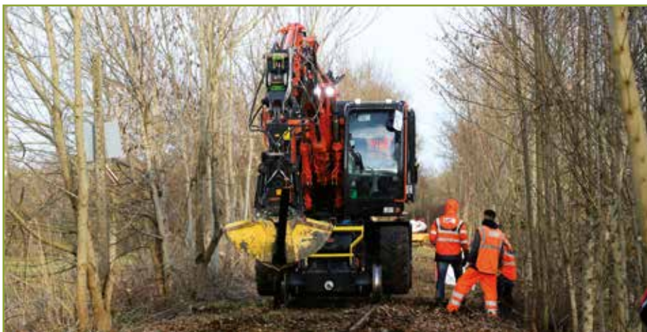
● Enlèvement des rails de l'ancienne voie ferrée.

Lancés en novembre dernier, les travaux métamorphosent, peu à peu, une partie de l'ancienne ligne de chemin de fer Dole-Poligny en voie verte.