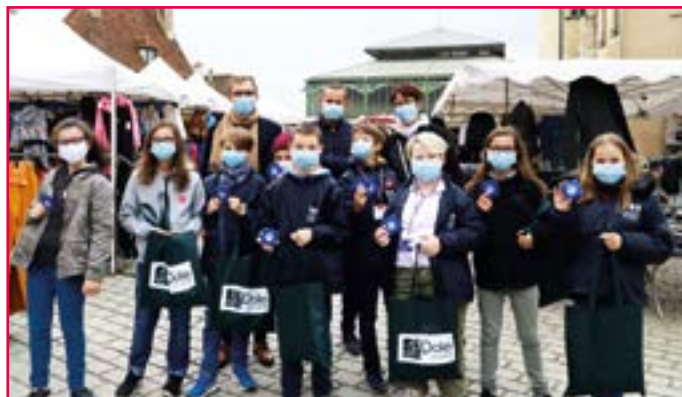
• Les élus de la commission "Environnement" ont distribué les cendriers au Centre-Ville.

Une opération destinée à sensibiliser la population sur la pollution que représentent les mégots.