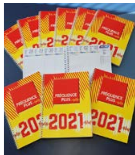
• Les agendas collector 2021.

N'oubliez pas d'indiquer vos coordonnées complètes dans votre courrier.