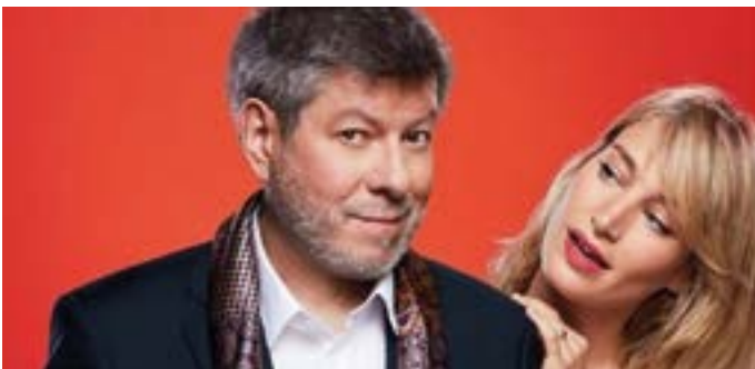
• "Le plus beau dans tout ça", le 19 mars 2021.

*sous réserve de l'évolution des mesures sanitaires