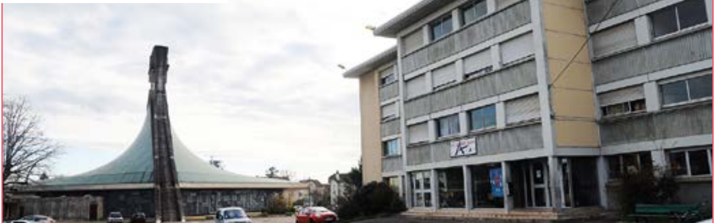
● Le Foyer Saint-Jean et l'église.