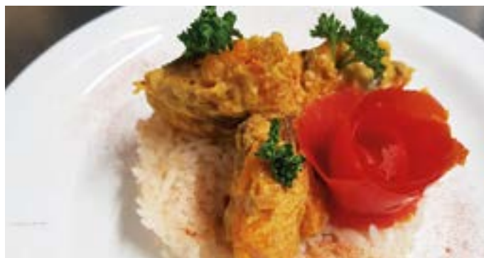
• Dahl de butternut et riz à la cardamome, un des repas végétariens proposés par la Grande Tablée.

On remplace les protéines animales par des protéines végétales, en associant des légumineuses et des céréales. Les œufs ne sont pas écartés, tout comme les produits laitiers dont l'apport en calcium est d'ailleurs à privilégier chez les enfants en pleine croissance.