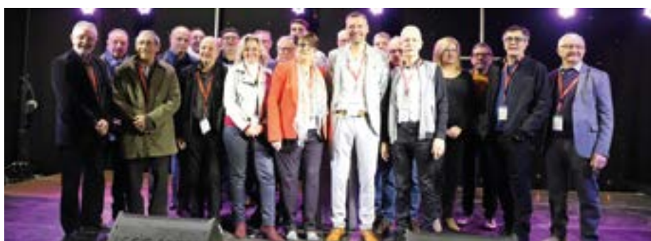
● L'équipe de l'association organisatrice lors des 39 e Journées de l'Habitat à Dolexpo.

Vous pouvez vous rendre sur le site www.journeeshabitatdole.fr pour