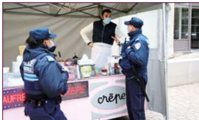
● Ronde de surveillance au Centre-Ville.

Tout cela traduit la volonté politique de la Ville en matière de sécurité : avoir une Police municipale efficace, armée, bien équipée et suffisamment nombreuse pour pouvoir assurer ses missions de sécurité publique dans les meilleures conditions possibles. Toutes les villes n'ont pas ce niveau d'intervention dans le domaine.