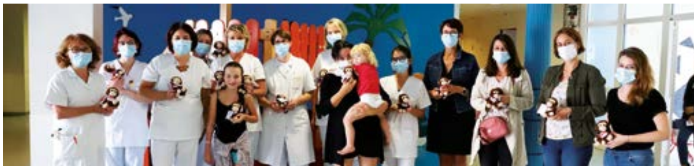
• L'équipe et les enfants de l'hôpital ont apprécié le geste du CME.

C'est une fin de mandat particulière qu'ont vécu les élus juniors, contraints de s'adapter à la crise sanitaire de 2020 qui a quelque peu bouleversé la mise en place des actions qu'ils avaient programmées durant cette deuxième et dernière année électorale.