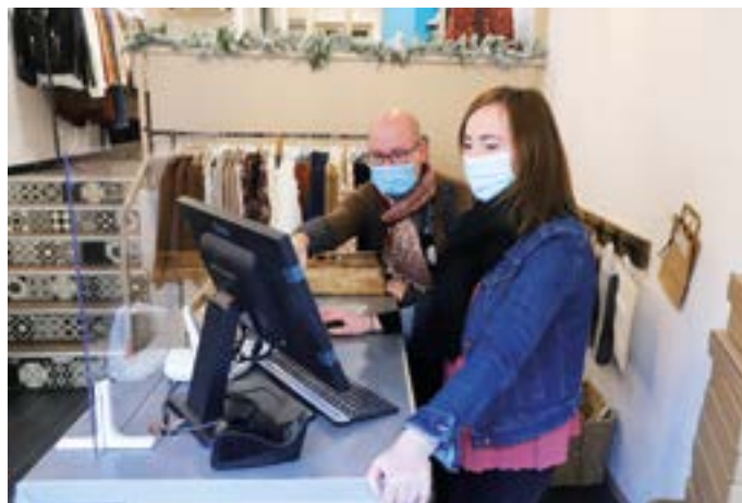
• Aide à la mise en ligne d'articles sur le site internet Achetez à Dole.