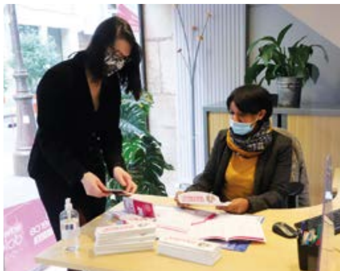
• Les agents préparent les K'Dole.