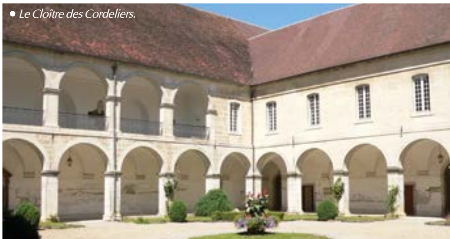
● Le Cloître des Cordeliers.