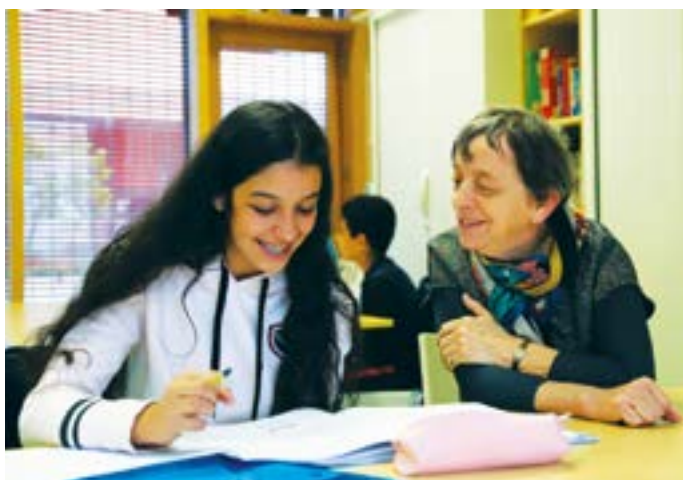
• L'aide aux devoirs (CLAS) est assurée par des bénévoles. (photo d'archive)