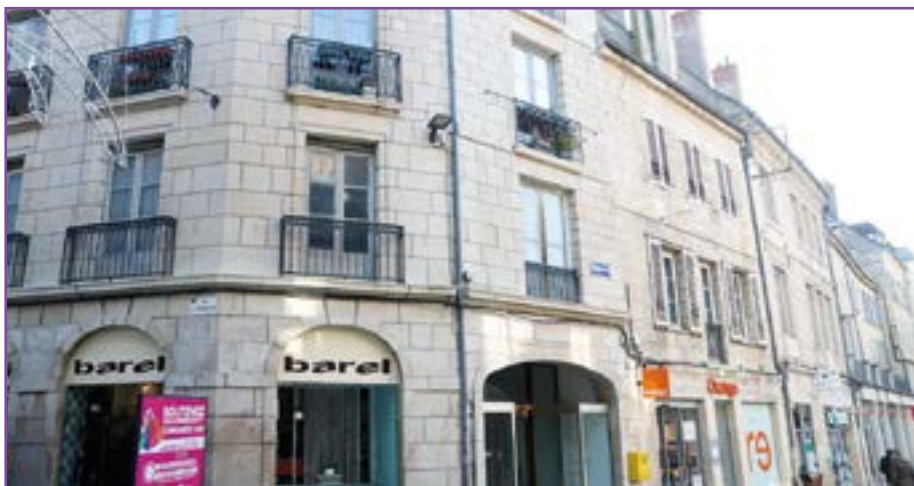
• Façades de la Place du 8 mai ayant bénéficié de cette opération.

À l'heure actuelle, une soixantaine de dossiers a d'ores et déjà bénéficié d'un accord de financement via ce dispositif, et les trois-quarts des opérations sont achevées, redonnant ainsi de l'attrait à ces immeubles par des travaux de ravalement, de nettoyage, de taille de pierres, de peinture, de ferronnerie ou de menuiserie. Initialement prévu jusqu'au 31 décembre 2020, le dispositif a été prolongé jusqu'en décembre 2021 après l'engagement de la municipalité dans le programme national Action Cœur de Ville.