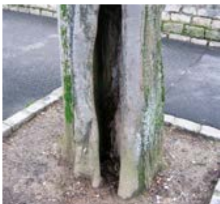
• Les tilleuls de la rue Rockefeller sont malades.

Concernant la rue Rockefeller, le projet de plantation est basé, non plus sur une seule espèce, mais sur trois essences d'arbres