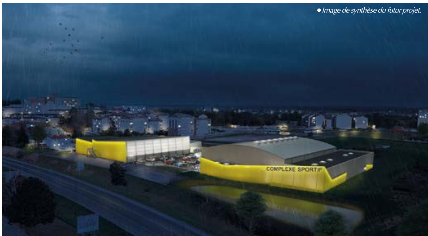
• Image de synthèse du futur projet.

Pour répondre à l'évolution des besoins des utilisateurs et pour adapter ses équipements sportifs aux normes actuelles, la municipalité a décidé de rénover le pôle composé du gymnase du COSEC et de la salle spécialisée de gymnastique Josette-Tournier. Des travaux qui s'inscrivent à la fois dans une logique de développement durable et dans une politique volontariste d'amélioration de la qualité des équipements.