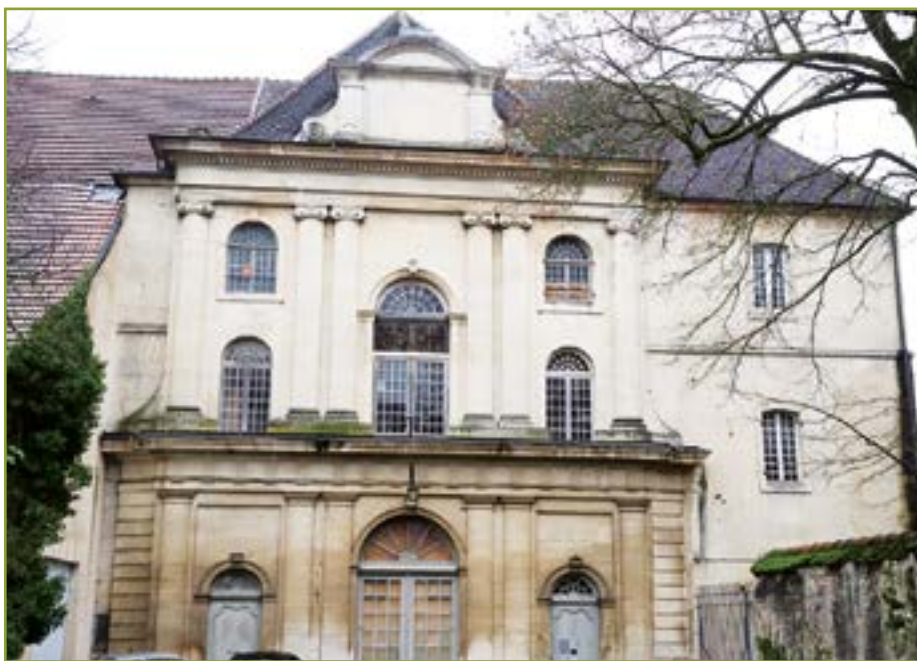
• Partenaire du projet, la Ville a fait l'acquisition d'une partie de cet ensemble architectural.

Après plus de 12 ans d'absence de projet pérenne, alors que le bâtiment est fermé et inutilisé depuis 2015 et qu'il se dégrade au fil des années, une solution a enfin été trouvée pour que ce site historique soit réhabilité, qu'il trouve une nouvelle destination tout en préservant un accès pour les visites du public.