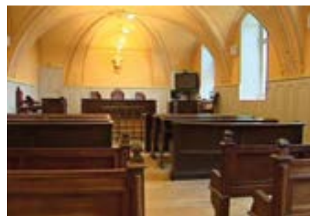
• Vue de l'ancienne salle d'audience du tribunal de Dole.