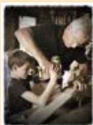
• Prix du jury