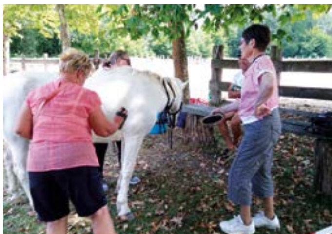
• Séance d'équithérapie organisée par le centre Escale.