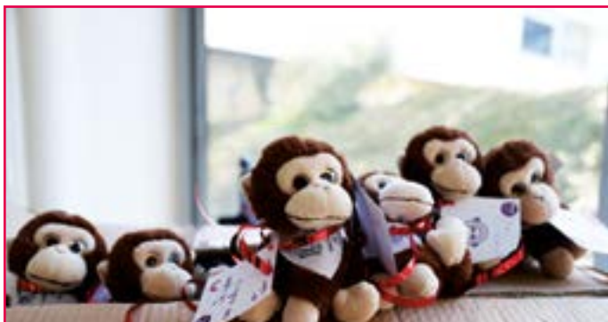
• Les peluches du CME sont bien arrivées à l'hôpital.

La commission "Solidarité" avait retenu le projet "Un doudou à l'hôpital" avec pour objectif "d'adoucir le séjour des enfants et de permettre aux soignants de distraire leurs jeunes patients" explique Simon, conseiller municipal junior.