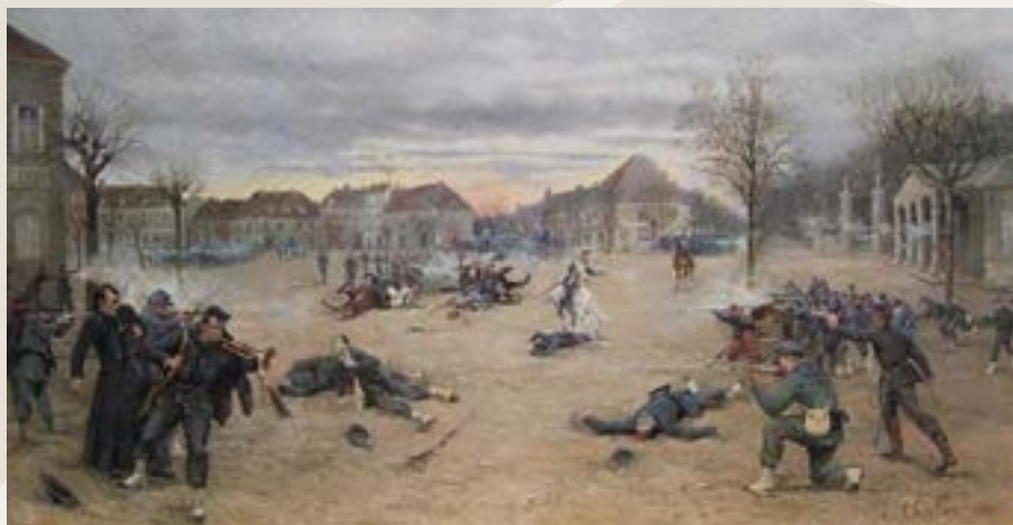
• "L'attaque de Dole par les Prussiens le 21 janvier 1871", 1889 Huile sur toile (dét.)

À quelques jours du 150 e anniversaire de cette bataille qui a marqué notre Ville, revenons sur cet événement qui permit, grâce à la courageuse résistance des Dolois, de retarder la progression prussienne dans son invasion de la France.