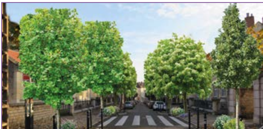
• Prévisualisation de la végétalisation de la rue Rockefeller avec les nouvelles plantations.

Après expertise de l'ONF qui a diagnostiqué le mauvais état sanitaire des tilleuls bordant la rue Rockefeller, il faut enlever ces arbres malades qui pourraient représenter un danger pour les passants en cas de chute de branches mortes. Le moment d'opter pour des essences plus adaptées à l'évolution climatique.