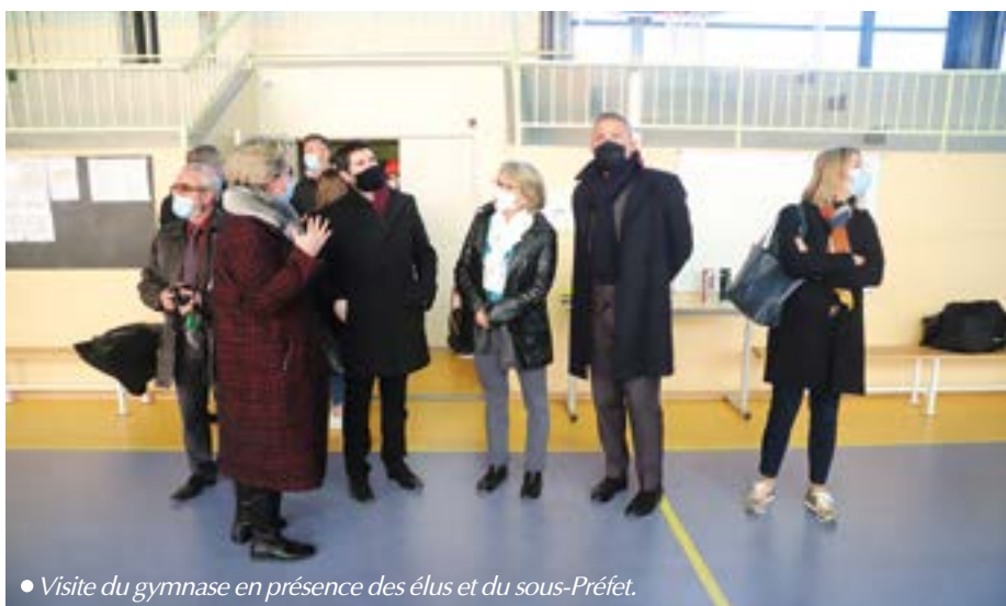
• Visite du gymnase en présence des élus et du sous-Préfet.

"Il y aura un confort supplémentaire dans la salle de gym, l'extension permet notamment d'obtenir une course d'élan suffisante pour le saut à cheval, ce qui était impossible dans l'ancienne salle. Deuxième point fort : les vestiaires indépendants. Cela évitera une cohabitation qui entraîne souvent des problèmes (mixité de personnes du troisième âge et d'élèves, ou bien encore les problèmes de vols..."