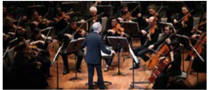
• "Les Pupitres en liberté".

Après une année "blanche" les Pupitres en Liberté reprendront place partout dans la ville les 27 et 28 mars. Le concert final aura lieu le dimanche 28 mars à 18 h à la Commanderie. Cette année l'Orchestre Victor-Hugo Franche-Comté nous proposera un programme avec pour pièce centrale, le "Gloria" de Vivaldi.