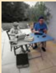
• Prix du public