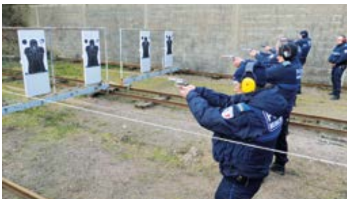
● Séance d’entraînement au tir à balles réelles.