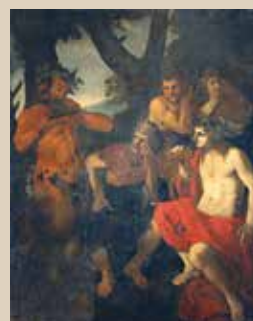
● Andrea Camassei "Le Jugement de Midas", 2 e quart du 17 e siècle Huile sur toile inv.CH323

Depuis le 16 janvier, le tableau de Camassei "Le Jugement de Midas" a été livré au Centre de Recherche et de Restauration des Musées de France, à Versailles, pour qu'un examen d'imagerie scientifique soit réalisé. Alors que cette huile sur toile, réalisée dans la première partie du XVII e siècle, a été mal restaurée il y a plus de 50 ans, l'investigation permettra de connaître l'ampleur des dégradations subies au niveau de la couche picturale, notamment la quantité des repeints, et d'évaluer le travail de restauration plus justement. Elle sera ensuite restaurée en 2025, dans la perspective d'une importante exposition sur les peintures italiennes anciennes en 2026, à l'échelle des musées du Jura.