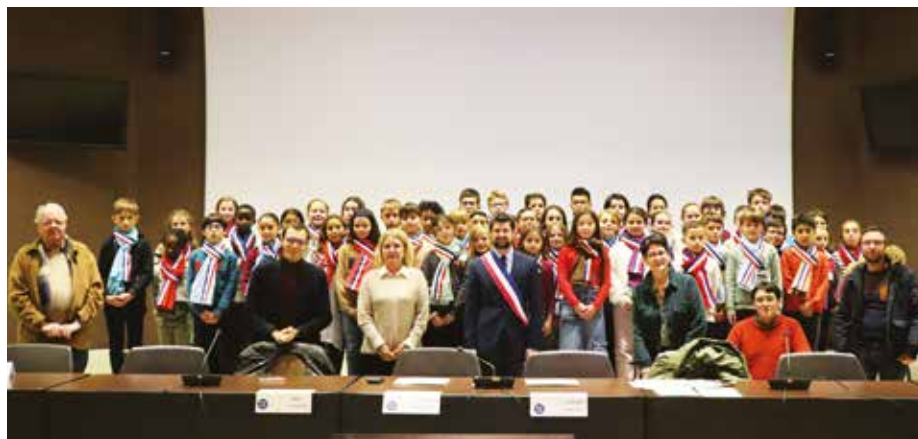
● Le nouveau Conseil Municipal des Enfants pour l'année scolaire 2023-2024.

comme l'année dernière, où nous avons fait un projet avec la SPA !", racontent-elles, à quelques minutes de la séance plénière. Un réel apprentissage de la citoyenneté pour ces porte-paroles de la jeunesse, qui ont officialisé leur engagement à travers le choix de commission pour lesquelles ils agiront dans le futur : environnement, solidarité ou vie des enfants. Chacune de