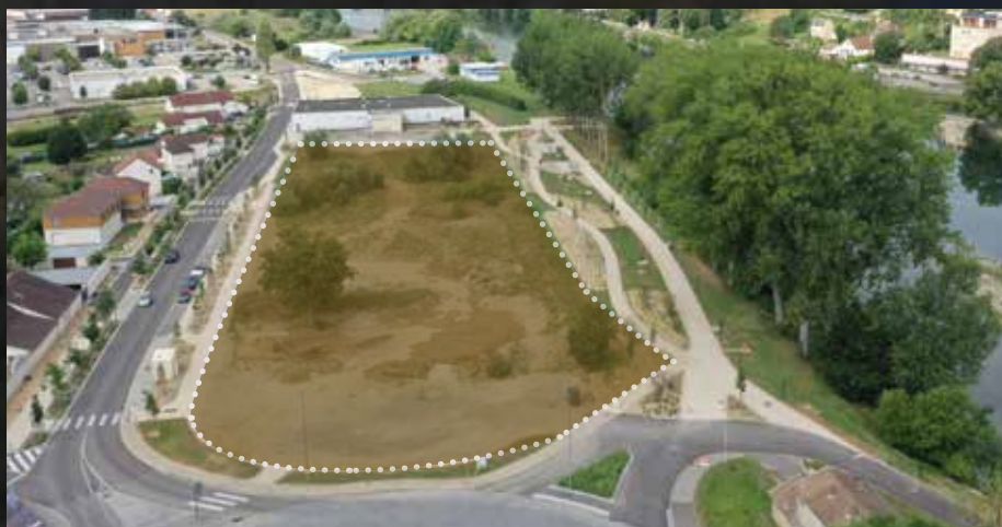
● Périphérie du futur multiplexe cinéma.

Les cinéphiles et habitants de la Ville de Dole pourront d'ailleurs très prochainement découvrir tous les contours de ce projet tant attendu, au cours d'une soirée spéciale de présentation, en avant-première, le mardi 19 mars à 19h , à La Commanderie de Dole.