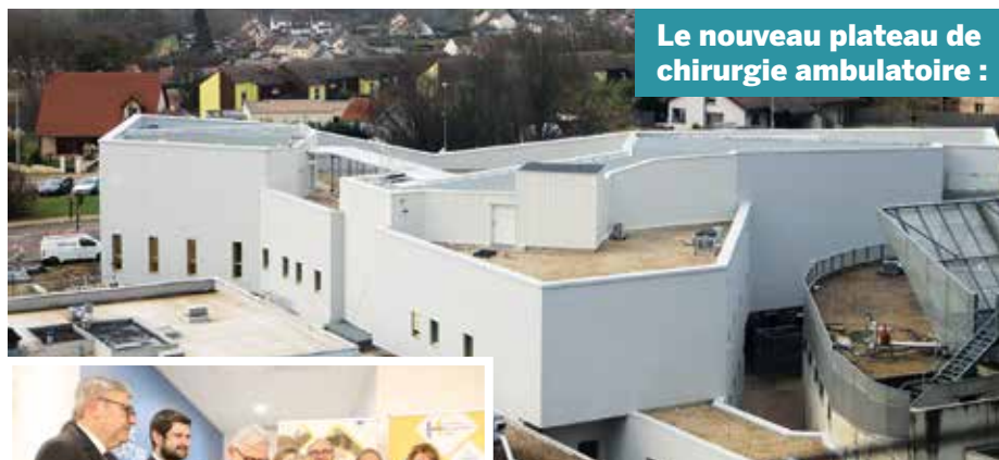
Le nouveau plateau de chirurgie ambulatoire :

Depuis plusieurs années, la Ville de Dole s'est mobilisée pour le maintien de la chirurgie publique sur le bassin dolois. En décembre 2018, un accord de coopération relatif à l'activité chirurgicale a été signé entre le Centre Hospitalier Louis-Pasteur de Dole (CHLP), le Centre Hospitalier Universitaire de Besançon (CHU) de Besançon et l'Agence Régionale de Santé (ARS) Bourgogne-Franche-Comté, prévoyant ainsi la création d'un nouveau plateau de chirurgie ambulatoire.