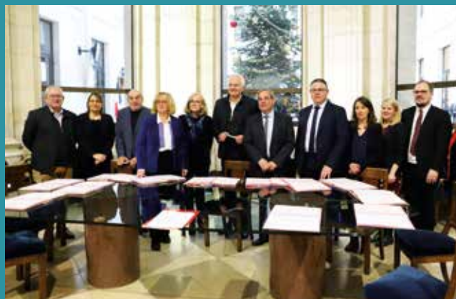
● Signature du Contrat Local de Santé