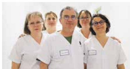
• Des chirurgiens dolois opéreront également au sein de ce nouvel espace.

Afin de permettre une meilleure prise en charge des patients, le Centre Hospitalier Louis-Pasteur a investi près de 1,7 millions d'euros, dont une grande partie dans l'achat d'équipements biomédicaux modernes, comme un microscope ORL, un laser pour l'urologie, ou encore une colonne vidéo 3D. Ce financement permettra également de renforcer la sécurité des soins et apportera davantage de confort aux patients, ainsi qu'aux personnels soignants, dont chacun connaît les contraintes et difficultés auxquelles ils sont soumis.