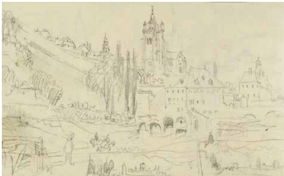
● Dole depuis le Sud-Ouest, esquisse, crayon graphite sur papier, vers 1836 Tate Britain (Londres)

Comme nombre d'artistes de son époque, William Turner voyage en Italie. En 1836, revenant d'Aoste, il emprunte une route très suivie au début du XIX e siècle, entre Dijon et Genève, portion d'un chemin qui permet de relier la Grande-Bretagne à l'Italie. Dans l'une des pages de son carnet de voyage, le célèbre peintre précise les étapes d'un chemin qu'il parcourt en diligence : Genève, La Vattay, Les Rousses, Morez, Saint-Laurent, Maisonneuve, Champagnole, Poligny, Mont-sous-Vaudrey, Dole, Auxonne, Genlis, Dijon. Arrivé à Dole, il fait quatre rapides croquis