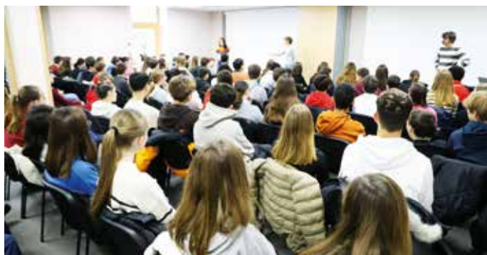
● Ateliers interactifs sur le thème de la République et de la laïcité

Parmi les différents sujets abordés, un thème d'actualité a été ajouté au programme : le harcèlement. Plus de 1 000 élèves ont assisté à plusieurs ateliers participatifs de sensibilisation, afin qu'ils puissent témoigner, dialoguer et réagir face au harcèlement scolaire sous toutes ses formes. À l'aide de vidéos scénarisées et de ciné-théâtre interactif, plusieurs questions ont été abordées et débattues : Internet et les réseaux sociaux, les discriminations, la liberté d'expression, le droit à l'image, le respect et la compréhension de l'autre, l'entraide... Une initiative inédite et importante que la Municipalité a voulu prioriser au travers de sa politique de prévention et de proximité.