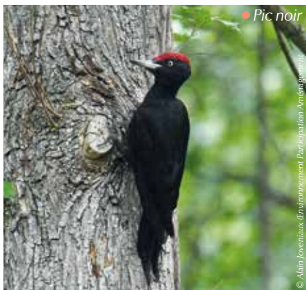
• Pic noir

La commune de Dole s'est engagée, via le dispositif Natura 2000, à mettre en œuvre deux îlots de vieillissement, où aucune intervention sylvicole n'aura lieu durant 30 ans. Cette action vise à laisser vieillir les arbres qui seront alors porteurs de nombreuses singularités (cavités, branches mortes, ...) qui sont nécessaires pour favoriser le développement de certaines espèces forestières comme les oiseaux ou les chauves-souris (refuges, zone d'alimentation, ...).