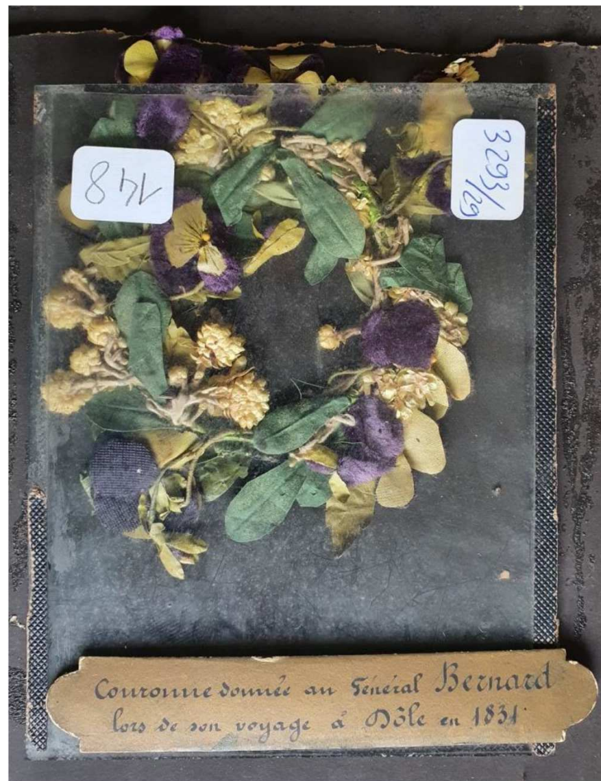
Couronne de fleurs offerte au Général à l'occasion de son voyage à Dole en 1831