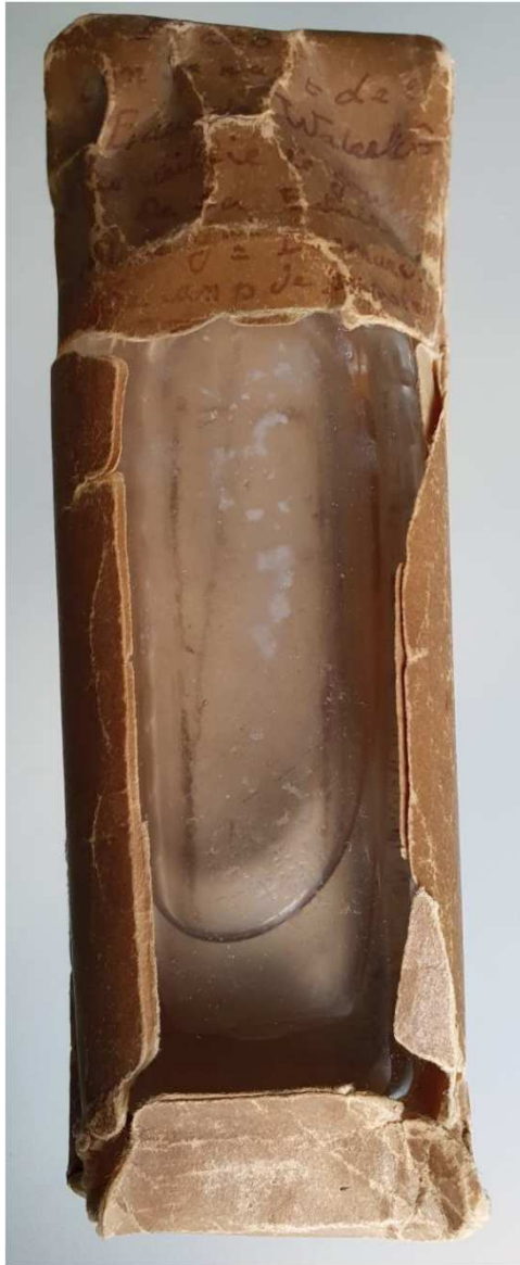
Flacon contenant l'eau de Waterloo