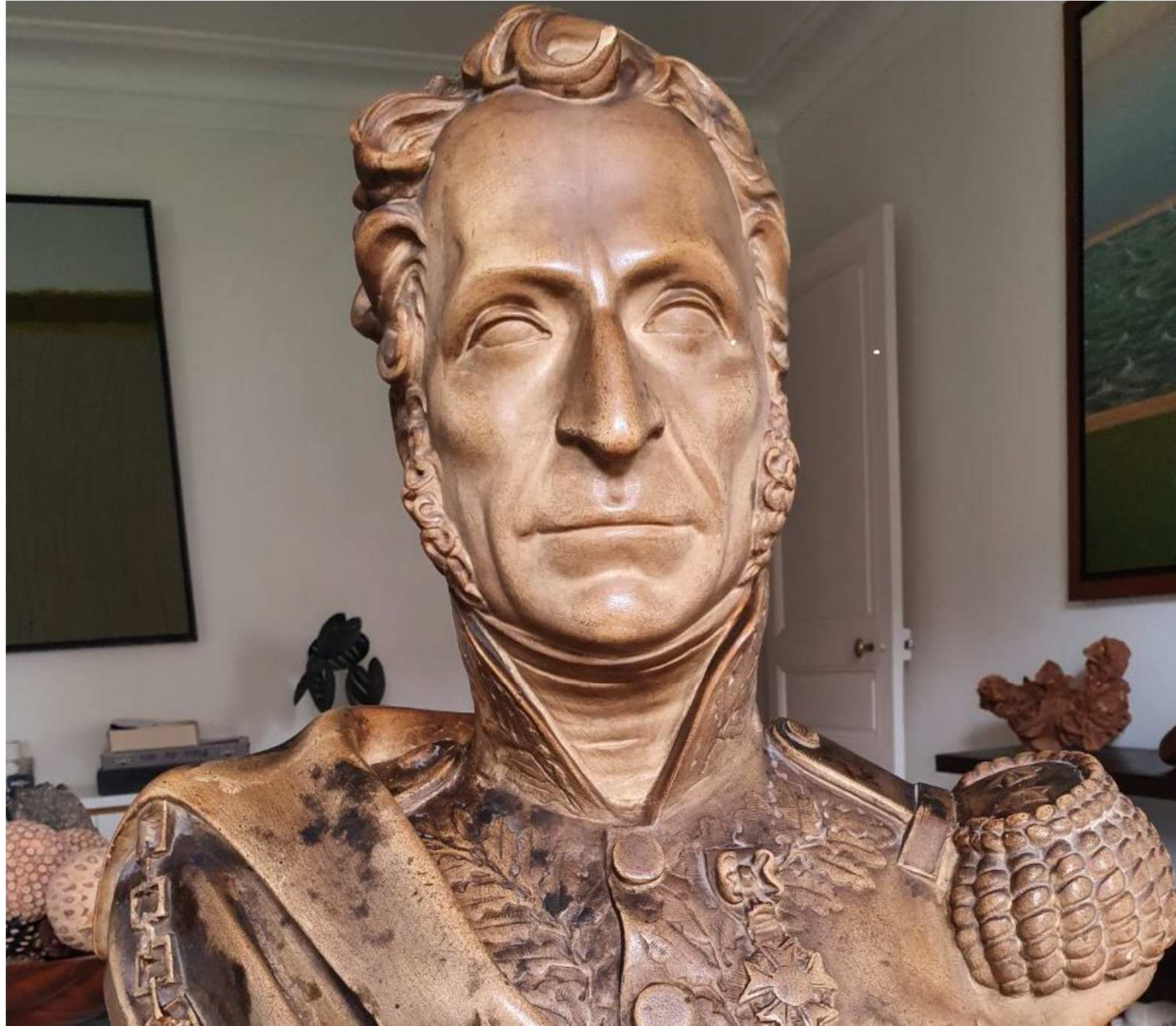
Buste du Général-baron Simon Bernard