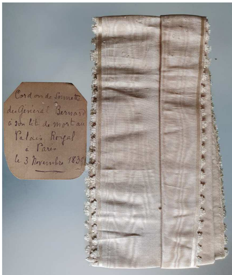
Cordon de sonnette du lit du Général à sa mort au Palais Royal le 3 novembre 1839